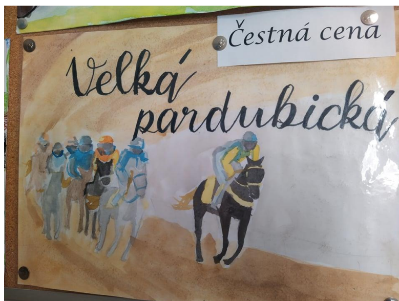
Výtvarná soutěž ke konání 131. Velké pardubické

25.7. – 29.7. 2021 Anglický příměstský tábor s rodilými mluvčími