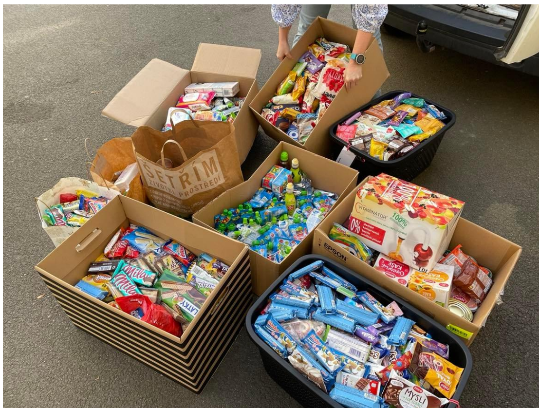
Potravinová pomoc pro Krajské asistenční centrum pomoci Ukrajině (KACPU)