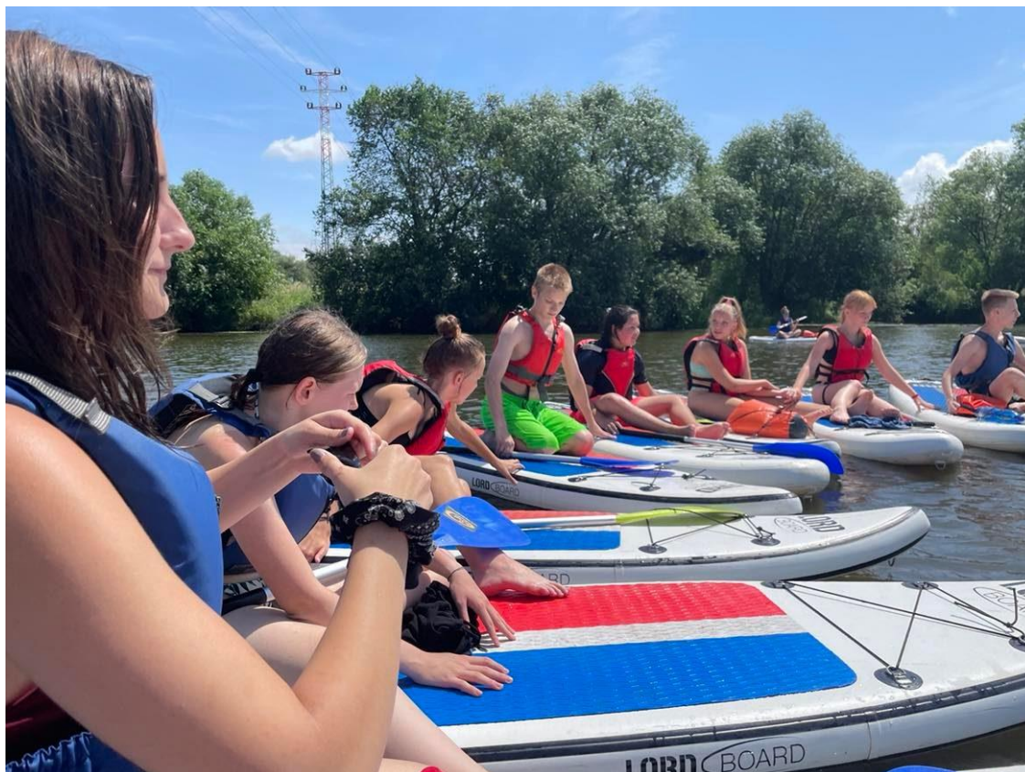
Kurz jízdy na paddleboardech Kunětice - Pardubice