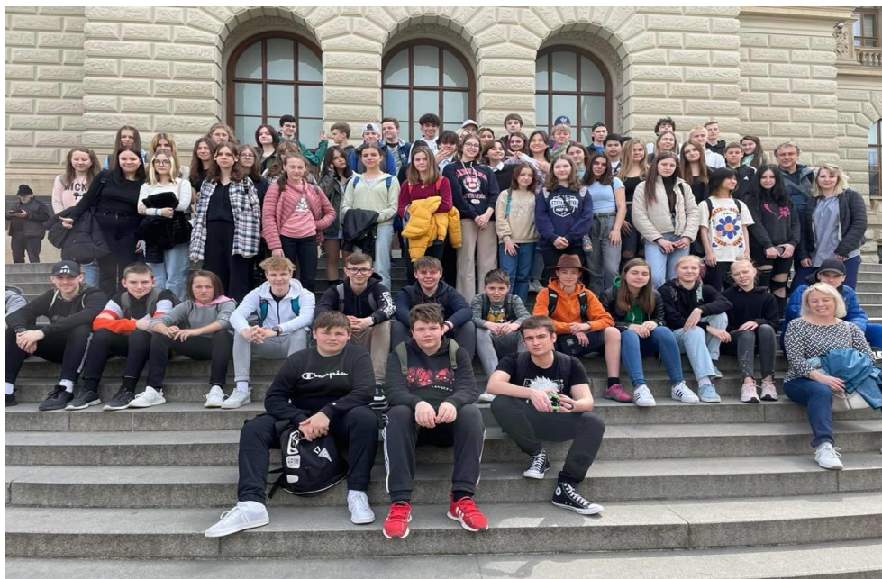
Den Země – exkurze do Národního muzea v Praze