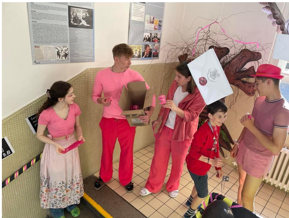
Barevné volby – třída 9.A