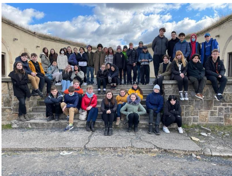
Třídenní workshop v Terezíně – 8. ročník

Na další vzdělávání pedagogických pracovníků jsme v roce 2021 vynaložili částku ve výši 35 597,- Kč.