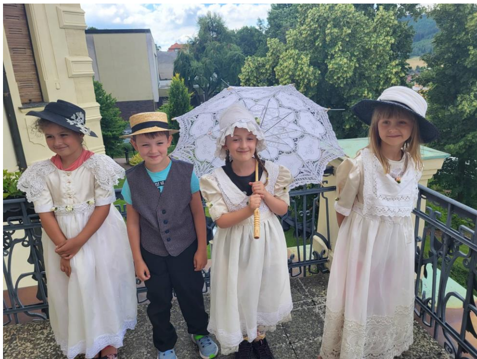
Třídní výlet 1.A – Ústí n.Orlicí