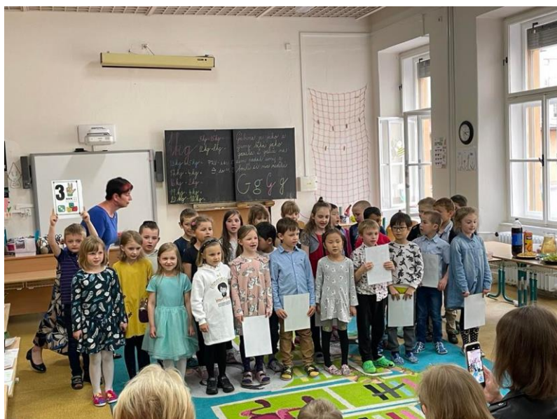
1.A – vystoupení pro maminky ke Dni matek