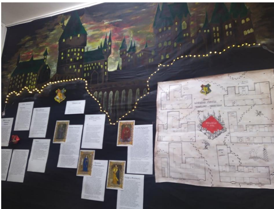
Celoroční projekt „Bradubická škola“