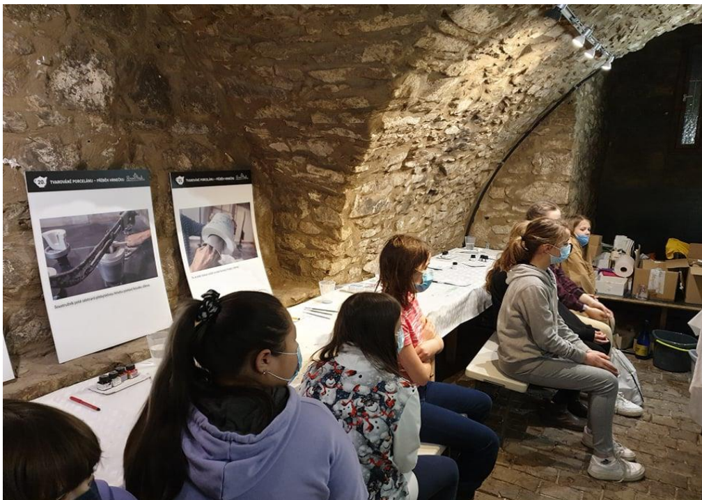
Mázhaus – výstava Bílé zlato (výroba porcelánu Rosenthal)

V závěru školního roku jsme byli osloveni Univerzitou Palackého v Olomouci s žádostí o spolupráci v Mezinárodním výzkumném projektu Světové zdravotnické organizace (WHO)- The Health Behaviour in School-aged Children (HBSC) ve školním roce 2021/2022.