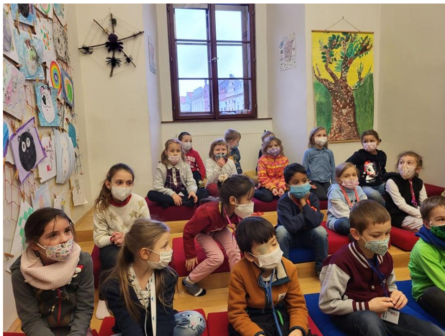
Prvnáčci v Krajské knihovně v Pardubicích